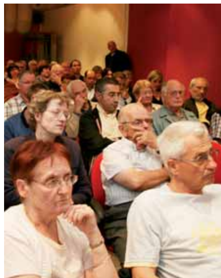
▲ Lors de la réunion publique le 11 juin

Et le maire de rassurer plus globalement : « Nous n'avons pas contracté ce prêt à la légère, nous étions conseillés, et personne ne nous a jamais alertés sur un quelconque risque encouru. A l'époque, les services du contrôle de légalité de la préfecture n'ont rien trouvé à redire... Bref, tout concourait à ne pas s'inquiéter, mais c'est toujours plus facile de donner des leçons a posteriori... Pour conclure, la ville n'est pas en faillite. Malgré l'inscription des intérêts sur le budget, nous dégageons 3,5 millions d'euros d'investissements nouveaux en 2012, et depuis sept ans, nous n'augmentons pas la part communale des impôts ». C'est effectivement concret, d'autant plus que le maire confirme la stabilité des taux pour les prochaines années.