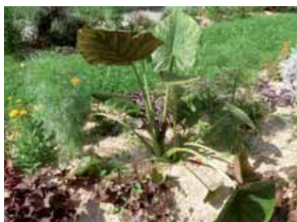
▲ Paillage devant la mairie

Le brûlage des déchets végétaux est interdit depuis quelques années par arrêté préfectoral (1) , considérant que son impact sur l'environnement et sur la santé publique est néfaste (2) , notamment du fait des fortes émissions de particules fines qu'il dégage. Ainsi, si vous tondez la pelouse ou que vous taillez les haies et que vous ne souhaitez pas faire un aller retour à la déchetterie, il reste une solution pour recycler ces déchets verts tout en protégeant vos plantations : le paillage végétal (3) . Cette technique consiste à recouvrir le sol accueillant arbustes fruitiers et d'ornement ou entre les légumes d'un potager avec des restes de tonte de pelouse ou de taille de haies broyée, de feuilles mortes ou encore d'écorces d'arbres (couche de 2,5 à 7 cm). Le paillage ne comporte presque que des avantages : en plus d'éviter l'érosion du sol, il retient l'eau et permet donc d'arroser moins souvent. Par ailleurs, la mise en place d'un paillage favorise le développement d'une vie micro-organique, qui agit favorablement sur la croissance des plantes. Attention toutefois à vérifier