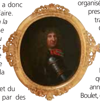
▲ Le portrait restauré

à Lyon. Dix couches de feuilles d'or ont parfois été nécessaires sur certaines parties du cadre pour lui redonner vie.